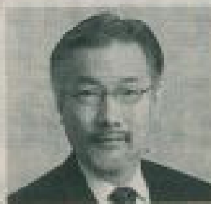
プロフィール (平仮名で読みかたあり)

1972年東北大学歯学部卒、1982年調布矯正歯科理学修士有期、1987年歯学博士、1993年調布矯正歯科クリニック開設、1995年日本矯正歯科学会副会長、1998年日本歯学協会副会長(小児歯科学)、2000年歯学教育賞(日本歯学協)、2004年フェリス大学医学部非常勤講師、2006年日本歯科医師会副会長(小児歯科学部)。