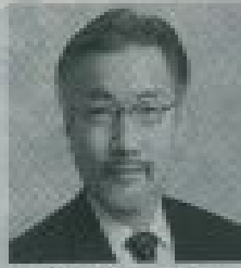
歯科矯正歯科クリニック院長