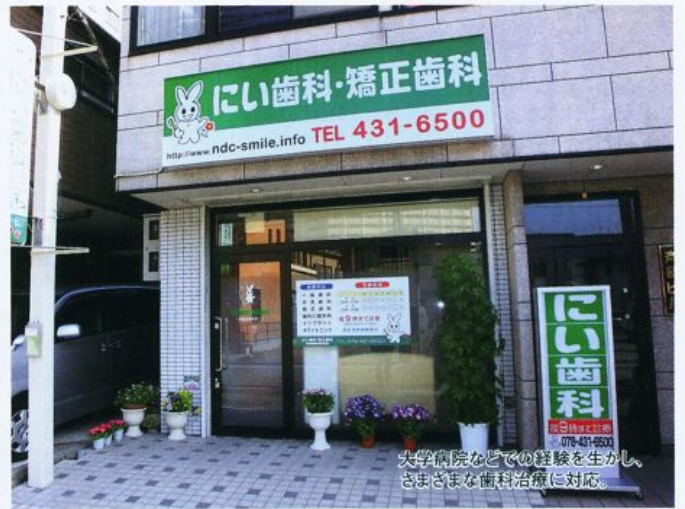
大学病院などでの経験を生かし、さまざまな歯科治療に対応。